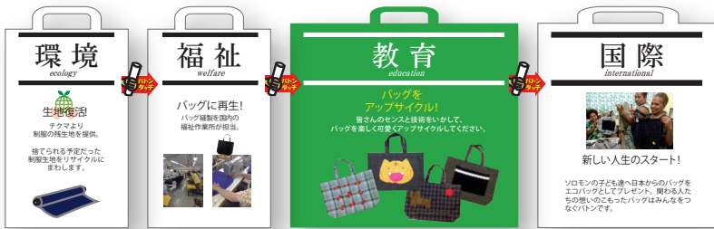
バトンバッグフロー図